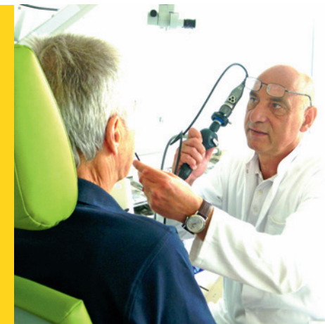
Onkologische Rehabilitation bei Erkrankungen im Kopf-Hals-Bereich